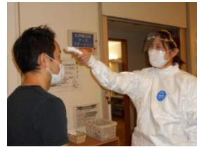
患者様入室時の検温