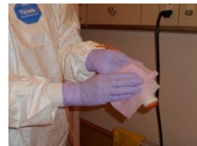
Ns コールも しっかりと