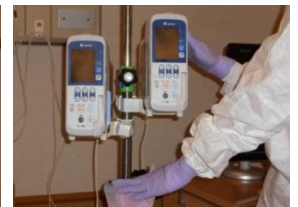
輸液ポンプも例外では ありません