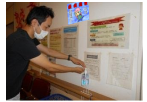
患者様自身の手指消毒