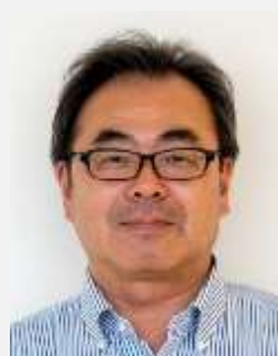
診療部長 (乳腺部門)