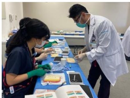
4月 シミュレーター研修