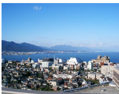
病院から見える景色