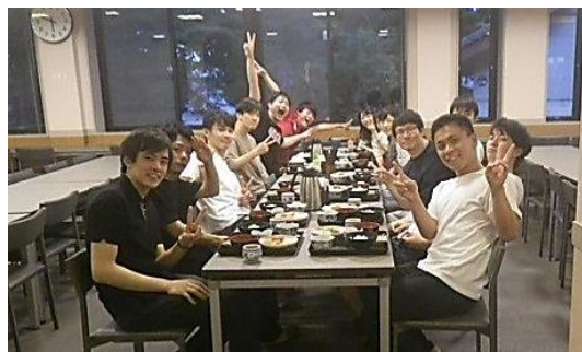
9月 西教寺でのリフレッシュ研修