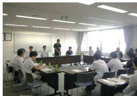
9月 研修管理委員会