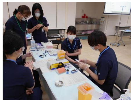
5月 縫合結紮セミナー