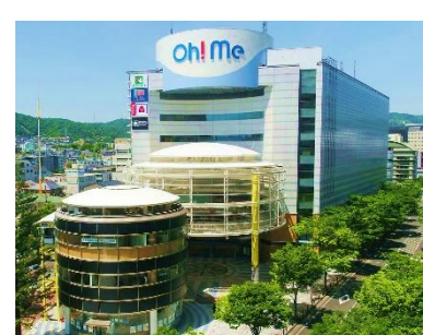
Oh! Me 大津テラス