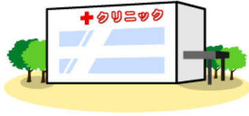
お近くの医療機関(かかりつけ医)

日ごろの健康管理や一般的な病気の治療については、まず「かかりつけ医」を受診しましょう。