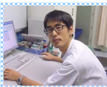
整 形 外 科