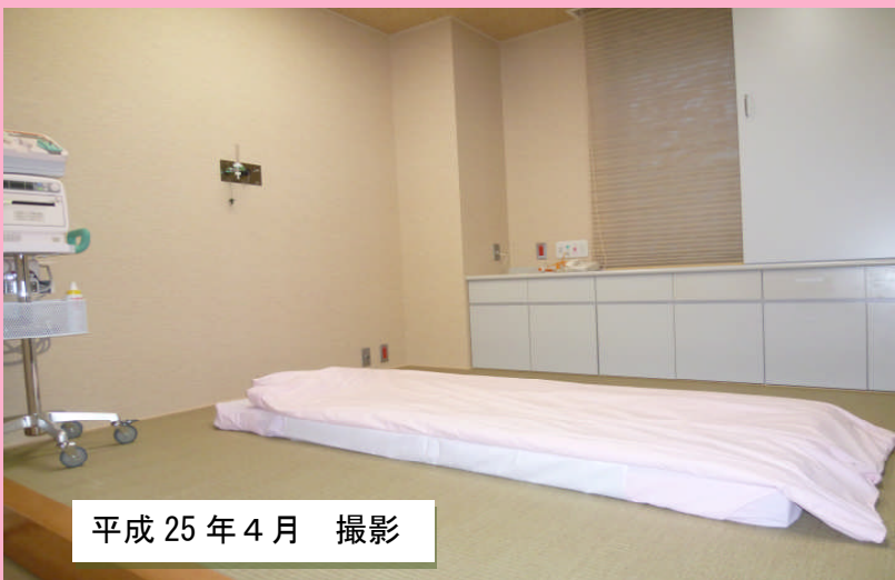
平成 25 年 4 月 撮影